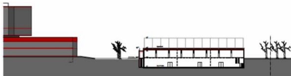
SCHNITT C - C