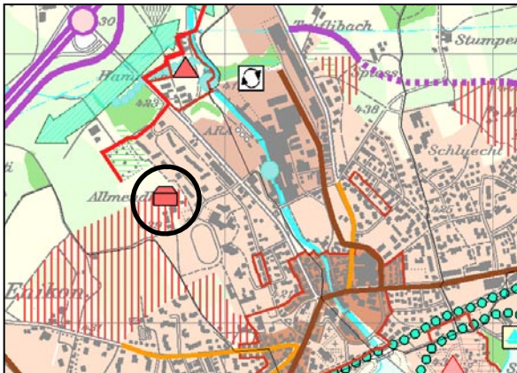
4 Kantonsschule Röhrliberg Cham