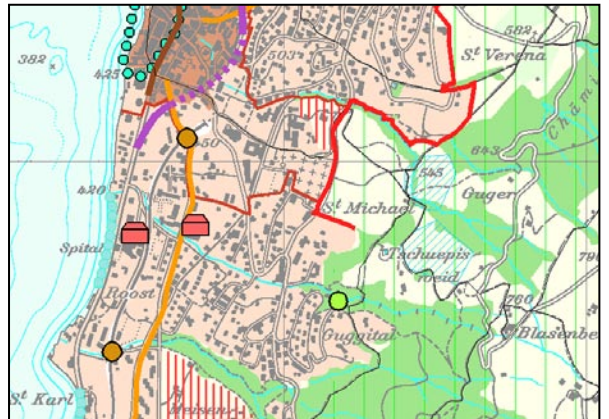
9 Institut Bernarda Menzingen